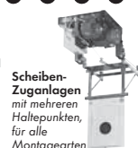
Scheiben- Zuganlagen mit mehreren Haltepunkten, für alle Montagearten

Postfach 1140 · D-35086 Battenberg Tel. (0 64 52) 93 32-0 · Fax: (0 64 52) 93 32-163 E-mail: info@johannsen.de Internet: www.johannsen.de